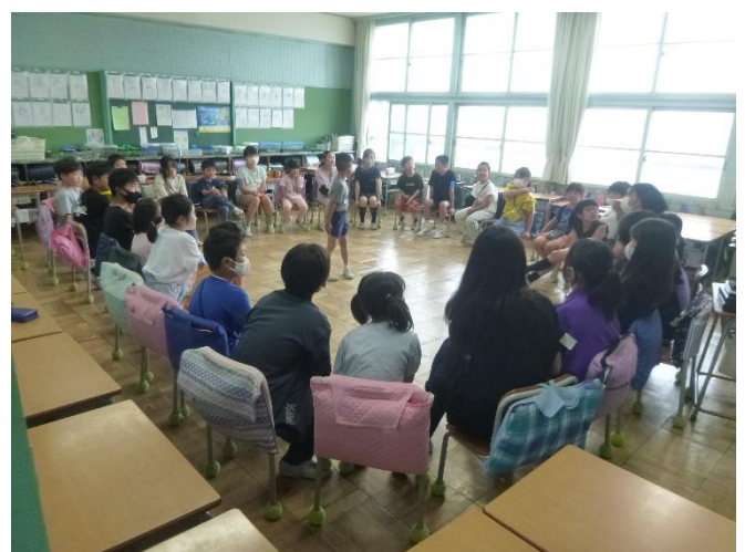
②関わり合い（縦割り班活動）