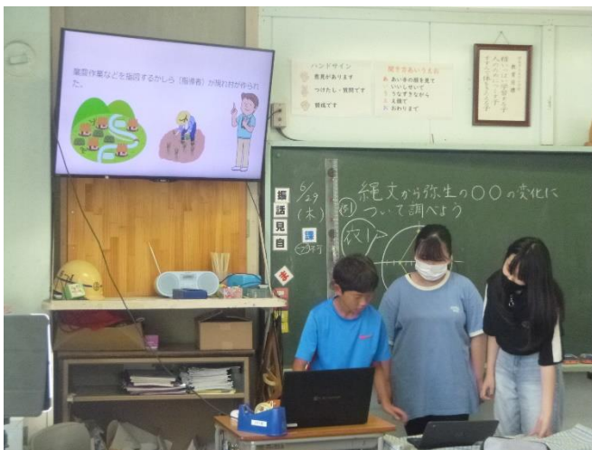
③可視化（社会の発表）