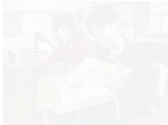
④タブレット活用（調べるツールの1つとしてのタブレット端末）