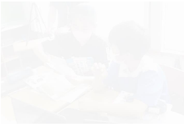
②関わり合い（思考ツールを介して対話する）